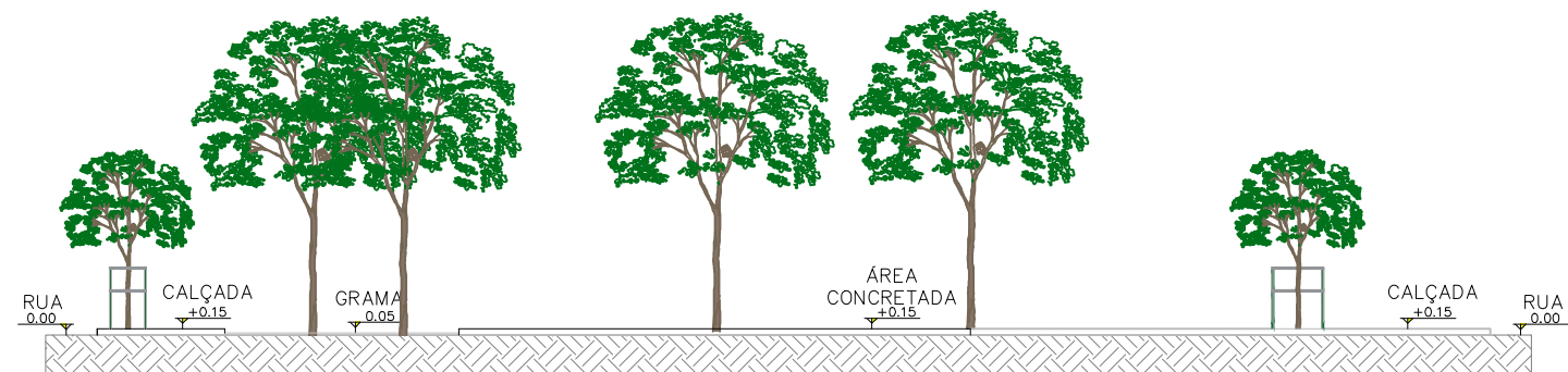
05 CORTE AA ESCALA: 1/200