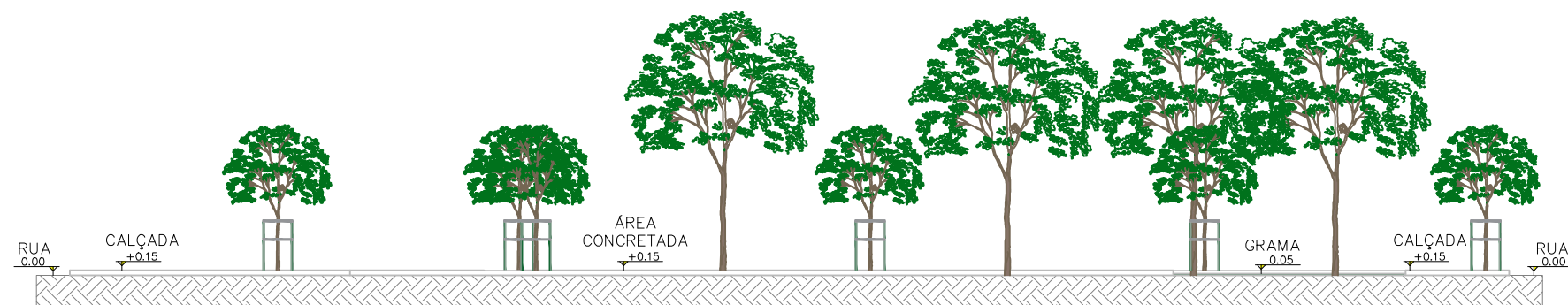
06 CORTE BB ESCALA: 1/200